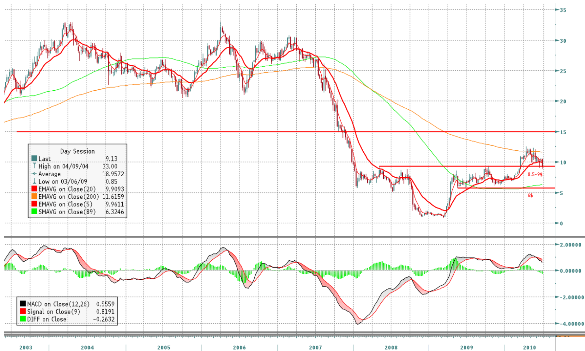
Graf 1 Týdenní graf Ruby Tuesday