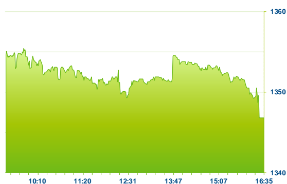
PX (předchozí den)

Pražská burza neudržela průběžné denní zisky a nakonec po závěrečné aukci oslabila o -0,19% na 1 346 bodů. S poklesem západoevropského finančního sektoru se nedařilo rakouským emisím. Erste Bank odepsala -0,56% na 795 Kč a pojišťovna Vig ubrala -0,94% na 629 Kč. Čez nakonec po závěrečné aukci oslabil -0,20% na 978 Kč. Akcie Colt CZ potom odepsaly -0,72% na 553 Kč. Naopak v kladném teritoriu uzavřely tuzemské banky. Moneta Money Bank stoupla o 0,60% s oceněním nad 84 Kč a Komerční banka přidala 0,15% na 673 Kč. Kofola zakončila silnější o 0,75% na 270 Kč.