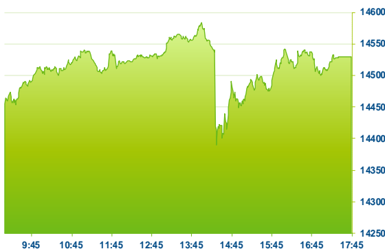
DAX (předchozí den)

Německý DAX zakončil uplynulou seanci mírným růstem. Nejlépe se dařilo akciím Vonovia (VNA; +3,0 %), Fresenius Medical Care (FME; 2,5 %) a Fresenius (FRE; +2,0 %). Největším poklesem zakončily tituly Symrise (SY1; -1,5 %), RWE (RWE; -1,4 %) a Munich Re (MUV2; -0,9 %).