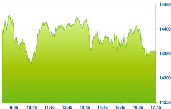
DAX (předchozí den)

Evropský index STOXX Europe 600 ke zakončuje obchodování v záporu 0,13 %. Mezi sektory se nejvíce dařilo spotřebnímu (+1,21 %) a finančnímu (+0,79 %) sektoru, naopak nejhůře na tom byly materiály (-1,63 %) a IT (-1,30 %). Z německého indexu DAX nejvíce odepsal Sartorius (-3,8 %) a nejvíce vzrostl Covestro (+3,2 %). Německo dnes podepsalo dohodu o dodávkách LNG z Kataru a meziroční index CPI v listopadu a dle předběžných dat vzrostl o 10 % při očekávání 10,3 %.