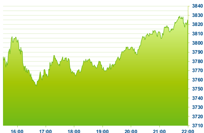
S&P 500 (předchozí den)

Změna kursu futures na americké indexy se počítá vzhledem k poslednímu vypořádání předchozího dne v 22:15. Změna kursu futures na DAX a Euro Stoxx 50 se počítá vzhledem k 22:30 předchozího dne. Změna kursu japonského indexu Nikkei 225 se počítá vzhledem k uzavření předchozího dne v 7:10. Změna kursu čínského Shanghai Composite se počítá vzhledem k uzavření předchozího dne v 08:00. Změna kursu hongkongského Hang Sengu se počítá vzhledem k uzavření předchozího dne v 9:20. Do této doby se index také obchoduje, uvedená hodnota tedy není závěr dnešního dne, ale poslední zachycený kurs v probíhající obchodování. Změna kursu měnových párů se počítá vzhledem k 22:50 předchozího dne. Změna kursu komodit se počítá vzhledem ke kursu v 23:45 předchozího dne. Uvedené časy jsou ve středoevropském čase (SEČ).