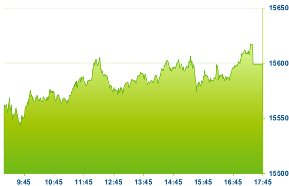
DAX (předchozí den)

Silněji rostly akcie výrobců automobilů poté, co report od Jato Dynamics ukázal, že elektromobil Tesly Model 3 byl v září nejvíce prodávaným autem v Evropě. Stal se tak prvním elektromobilem, který se umístil na vrchol tohoto žebříčku. Posilovaly tak akcie Porsche Automobil (PAH3; +4,7 %), Volkswagen (VOW3; +4,7 %), BMW (BMW; +2,2 %). Z indexu DAX se dařilo také akciím SAP (SAP; +2,0 %) a Qiagen (QIA; +1,6 %). Klesaly naopak akcie Henkel (HEN3; -1,8 %), Delivery Hero (DHER; -1,8 %), RWE (RWE; -1,6 %), Airbus (AIR; -1,6 %) a Deutsche Wohnen (DWINI; -1,2 %).