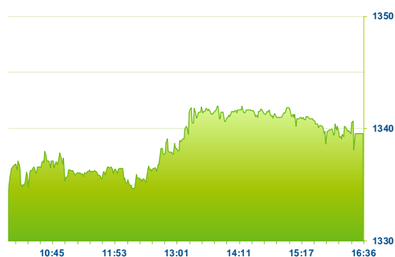
PX (předchozí den)

Pražská burza v úvodu nového týdne přerušila sérii devíti poklesů v řadě, když si měřeno indexem PX polepšila o 0,70% na 1 339 bodů. Tahounem růstu se staly emise Čez a Komerční banka tedy tituly, které v uplynulých dnech nejvíce ztrácely. Elektrárenská emise nezaznamenala růstovou seanci osm dní v řadě, nicméně dnes si polepšila o 1,50% na 744 Kč. Komerční banka potom se zvedla o 2,08% na 858 Kč. Dařilo se i pojišťovně Vig se ziskem 1,08% na 653 Kč. Kofola zakončila silnější o 0,94% na 323 Kč. Erste Bank stoupla o mírných 0,37% na 974 Kč, naopak Moneta Money Bank ubrala -0,28% s oceněním pod 88 Kč.