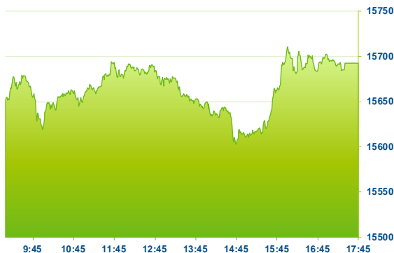
DAX (předchozí den)

Evropským trhem se dnes šířila dobrá nálada, na závěr seance vykazaly největší růst sektory informační technologie (+1,64 %), realit (+0,98 %), financí (+0,92 %) a průmyslu (+0,85 %). V záporných hodnotách dnes uzavřely energie (-0,64 %) a spotřební zboží (-0,27 %). Německý DAX se dnes pomalým tempem přiblížil k hodnotě 15700 b., která představuje důležitou úroveň obchodní aktivity, na které za poslední měsíc došlo mnohokrát k tržnímu obratu. Trh ani dnes nedokázal tuto hodnotu překonat. S čtvrtletními výsledky dnes přišla německá společnost Siemens Energy (ENR), která svými výsledky za 3Q nedosáhla na průměrné analytické odhady a během dne odepsala 2,63 % na 22,95 EUR. Zítřejší den nabídne více firemních výsledků ke sledování, když své hospodářské výsledky budou představovat společnosti Merck, Deutsche Post, Siemens, Bayer, Continental a Adidas. Německé statistické úřady dnes reportovaly o vývoji indexu nákupních manažerů. Ten v červenci dle konečných dat při hodnotě 61,8 b. nedokázal překonat analyticky stanovený konsensus na úrovni 62,2 b. Koruna dnes proti euru vykazuje známky pozvolného posilování při ceně měnového páru na 25,42 EURCZK.