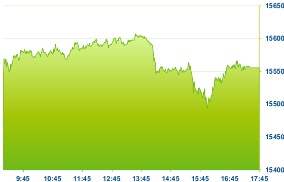
DAX (předchozí den)

Index DAX až do odpoledních hodin pomalým tempem rostl, po 14. hodině však klesl do záporných čísel a uzavřel se ztrátou o 0,07 % na 15557,68 b. Ačkoli evropský index STOXX 600 sledoval podobný trend, pohyboval se na vyšší hladině a uzavřel se ziskem o 0,23 % na 465,50 b. V evropském prostoru zaznamenal největší růst sektor energií (+2,65 %), dále více rostl sektor materiálů (+0,54 %). Žádný jiný sektor nevykázal výraznější změnu. Největší pokles z indexu DAX vykázaly akcie automobilky BMW (BMW; -5,0 %), která i přes nad očekávání dobré výsledky podala nejistý výhled z důvodu pokračujícího světového nedostatku čipů. Tento výhled sdílí celé automobilové odvětví a obavy z čipové krize se promítly i na akciích dalších automobilek (Daimler – DAI; -1,1 %, Volkswagen – VOW3; -0,68 %). Klesaly také akcie společností MTU Aero Engines (MTX; -2,1 %), Munich Re (MUV2; -1,4 %) a Deutsche Boerse (DB1; -0,9 %). Rostly akcie společností Fresenius Medical Care (FME; +3,3 %), Fresenius (FRE; +3,0 %), Adidas (ADS; +1,6 %), Siemens Energy (ENR; +1,4 %) a BASF (BAS; +1,0 %).