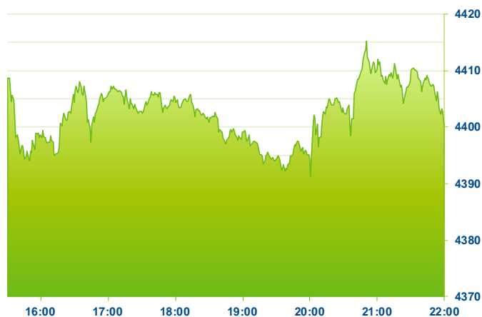
S&P 500 (předchozí den)

Změna kursu futures na americké indexy se počítá vzhledem k poslednímu vypořádání předchozího dne v 22:15. Změna kursu futures na DAX a Euro Stoxx 50 se počítá vzhledem k 22:30 předchozího dne. Změna kursu japonského indexu Nikkei 225 se počítá vzhledem k uzavření předchozího dne v 7:10. Změna kursu čínského Shanghai Composite se počítá vzhledem k uzavření předchozího dne v 08:00. Změna kursu hongkongského Hang Seng se počítá vzhledem k uzavření předchozího dne v 9:20. Do této doby se index také obchoduje, uvedená hodnota tedy není závěr dnešního dne, ale poslední zachycený kurs v probíhajícím obchodování. Změna kursu měnových párů se počítá vzhledem k 22:50 předchozího dne. Změna kursu komodit se počítá vzhledem ke kursu v 23:45 předchozího dne. Uvedené časy jsou ve středoevropském čase (SEČ).