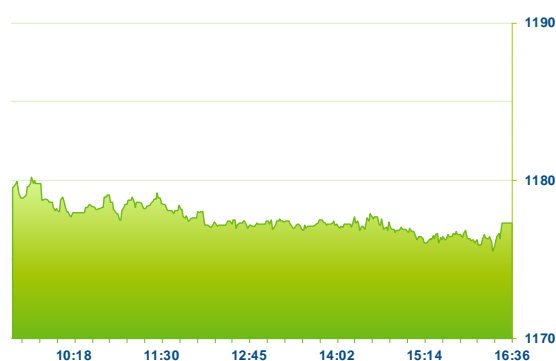
PX (předchozí den)

Moneta dnes oznámila pokračování prodeje úvěrových pohledávek v selhání v hodnotě 191 mil. Kč, čímž navázala na předchozí prodej defaultních pohledávek v sumě 340 mil. Kč. UDI CEE informovala o záměru společnosti Urban Developers and Investors o koupi neomezeného počtu akcií.