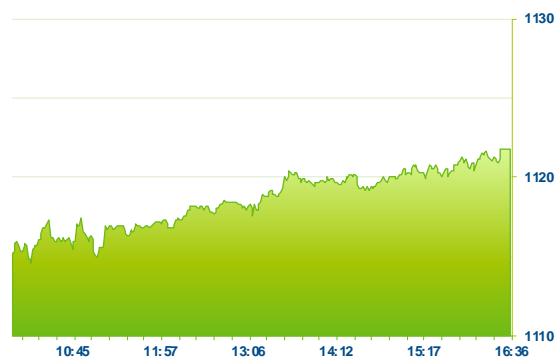
PX (předchozí den)

Pražská burza si v závěru týdne připsala nejsilnější seanci od začátku února. Index PX posílil o 1,48 % a vylepšil svá více jak roční maxima. V kladných číslech zakončily den všechny emise z hlavního trhu. Tahounem růstu byla tak jako v posledních dnech Erste Group (+3,35 %). Titul od zveřejnění výsledků na konci dubna posílil již o téměř 12 % a podstatně překonává výkonnost evropského bankovního sektoru. Na vyšší úroveň se posunula i Komerční banka (+0,59 %), zde je však vývoj nadále podstatně umírněnější. Moneta dnes pořádala konferenční hovor k plánované akvizici AirBank. Z průběhu hovoru bylo patrné, že minimálně u části českých akcionářů obavy z předraženého nákupu aktiv od PPF rozptýleny nebyly. Kurz akcií posílil o 1,06 %, ale nadále se pohybuje pod hranicí 80 Kč, která by připadala v úvahu jako odkupní cena v případě, že transakce bude odsouhlasena. Po sérii dvou nových doporučení z tohoto týdne se dostaly výše akcie České zbrojovky, které končily týdne na 376 Kč se ziskem 1,62 %. Potvrzený celkový výnos pro akcionáře ve výši 21 Kč povzbudil i zájem o akcie O2, které zavíraly nad hranici 270 Kč (+1,5 %). Absolutně nejvyšší zhodnocení si nakonec připsaly akcie Stock Spirits, které posílily o 3,58 % na 83,90 Kč.