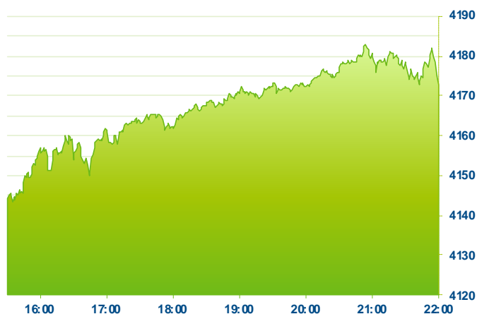
S&P 500 (předchozí den)

Změna kursu futures na americké indexy se počítá vzhledem k poslednímu vypořádání předchozího dne v 22:15. Změna kursu futures na DAX a Euro Stoxx 50 se počítá vzhledem k 22:30 předchozího dne. Změna kursu japonského indexu Nikkei 225 se počítá vzhledem k uzavření předchozího dne v 7:10. Změna kursu čínského Shanghai Composite se počítá vzhledem k uzavření předchozího dne v 08:00. Změna kursu hongkongského Hang Sengu se počítá vzhledem k uzavření předchozího dne v 9:20. Do této doby se index také obchoduje, uvedená hodnota tedy není závěr dnešního dne, ale poslední zachycený kurs v probíhající obchodování. Změna kursu měnových párů se počítá vzhledem k 22:50 předchozího dne. Změna kursu komodit se počítá vzhledem ke kursu v 23:45 předchozího dne. Uvedené časy jsou ve středoevropském čase (SEČ).