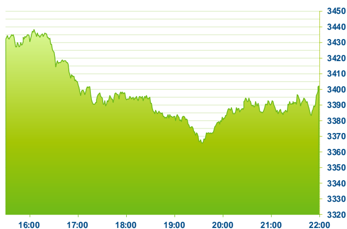
S&P 500 (předchozí den)

Změna kursu futures na americké indexy se počítá vzhledem k poslednímu vypořádání předchozího dne v 22:15. Změna kursu futures na DAX a Euro Stoxx 50 se počítá vzhledem k 22:30 předchozího dne.