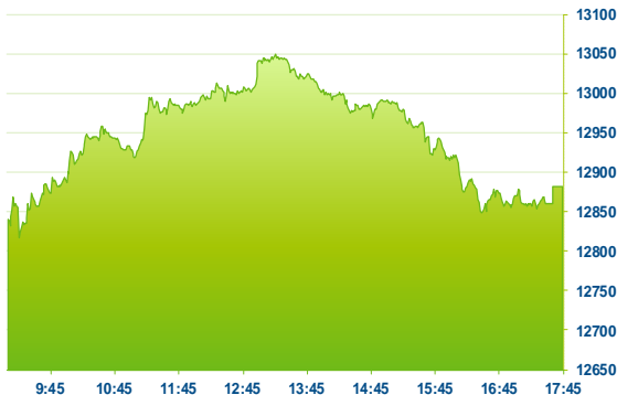
DAX (předchozí den)

Index DAX odepsal 0,3 % na 12881,76 b. Index DAX otevřel v mírném záporu, během dopoledne mírně rostl, aby odpoledne opět plynule zamířil k záporné nule bez výraznějších kurzotvorných zpráv. Druhý den rostly akcie výrobce plastů Covestro (1COV; +2,7 %) v reakci na slova finančního ředitele, který očekává lepší výsledky za 3Q. Např. analytici Jefferies dnes tak zvýšili své odhady. Dařilo se také akciím Wirecard (WDI; +6,2 %) a Henkelu (HEN3; +1,2 %). Nejvíce oslabil výrobce leteckých motorů MTU Aero Engines (MTX; -1,9 %).