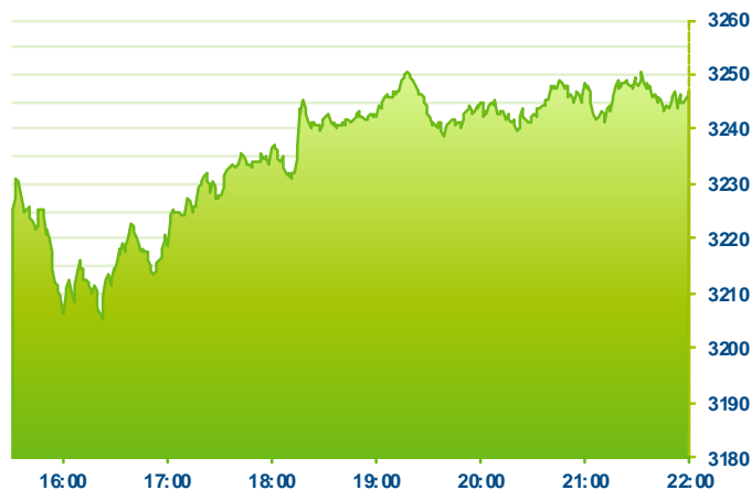
S&P 500 (předchozí den)

Změna kursu futures na americké indexy se počítá vzhledem k poslednímu vypořádání předchozího dne v 22:15. Změna kursu futures na DAX a Euro Stoxx 50 se počítá vzhledem k 22:30 předchozího dne.