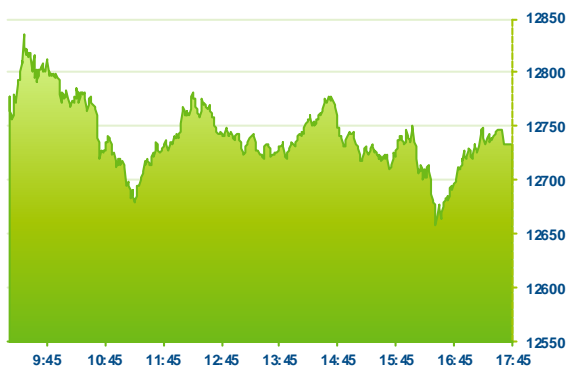
DAX (předchozí den)

Index DAX uzavírá pondělní obchodování růstem o 1,64%. Index dnes nejvíce táhnul Finanční sektor, kde dominovaly akcie Deutsche Bank ( DBK ), které si polepšily o 3,9%. V dalším růstu pak pokračovaly akcie známé cementárny Heidelberg cement ( HEI ), které těží z doporučení od analytiků Morhan Stanley z "underweight" na "overweight" a dnes si akcie připsaly zisk více než 2%. Naopak se nedařilo akciím Wirecardu ( WDI ), které si odepsaly -20,6%.