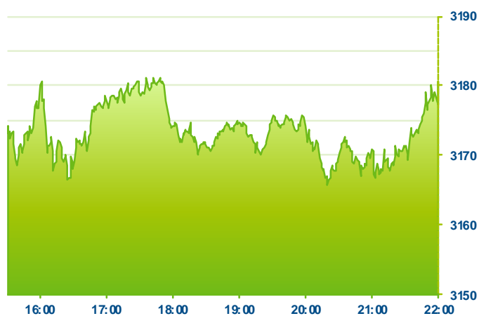
S&P 500 (předchozí den)

Změna kursu futures na americké indexy se počítá vzhledem k poslednímu vypořádání předchozího dne v 22:15. Změna kursu futures na DAX a Euro Stoxx 50 se počítá vzhledem k 22:30 předchozího dne.