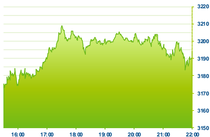
S&P 500 (předchozí den)

Změna kursu futures na americké indexy se počítá vzhledem k poslednímu vypořádání předchozího dne v 22:15. Změna kursu futures na DAX a Euro Stoxx 50 se počítá vzhledem k 22:30 předchozího dne.