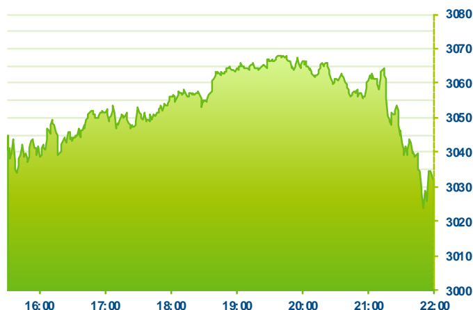
S&P 500 (předchozí den)

Změna kursu futures na americké indexy se počítá vzhledem k poslednímu vypořádání předchozího dne v 22:15. Změna kursu futures na DAX a Euro Stoxx 50 se počítá vzhledem k 22:30 předchozího dne.