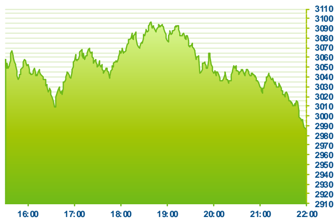
S&P 500 (předchozí den)

Změna kursu futures na americké indexy se počítá vzhledem k poslednímu vypořádání předchozího dne v 22:15. Změna kursu futures na DAX a Euro Stoxx 50 se počítá vzhledem k 22:30 předchozího dne.