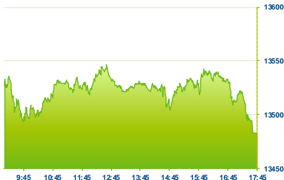
DAX (předchozí den)

Z celého indexu neuzavřel v plusu ani jeden titul, Deutsche Bank stagnovala. Mírnější ztráty si připsaly společnosti SAP (SAP; -0,2 %), Bayer (BAYN; -0,1 %) či Continental (CON; -0,1 %).