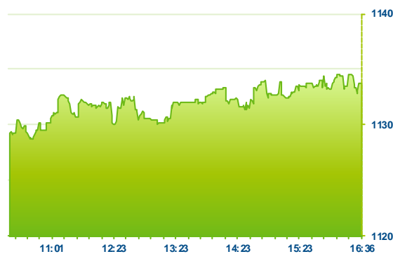
PX (předchozí den)

Nezanedbatelné poklesy zaznamenaly bankovní tituly, nejvýrazněji oslabovala Komerční banka (-1,07 %). Ani zbývající Moneta (-0,89 %) a Erste (-0,93 %) si však nevedly o mnoho lépe. Více než procento odepsaly také telekomunikační O2 (-1,26 %), textilka PFNonwovens (-1,17 %) či pojišťovna VIG (-1,26 %). Ještě o něco výrazněji ztrácel ČEZ (-1,48 %). Zbývající společnosti oslabovaly do 1 %, Kofola stagnovala.