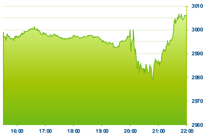
S&P 500 (předchozí den)

Změna kursu futures na americké indexy se počítá vzhledem k poslednímu vypořádání předchozího dne v 22:15. Změna kursu futures na DAX a Euro Stoxx 50 se počítá vzhledem k 22:30 předchozího dne.