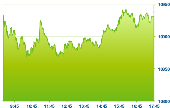
DAX (předchozí den)