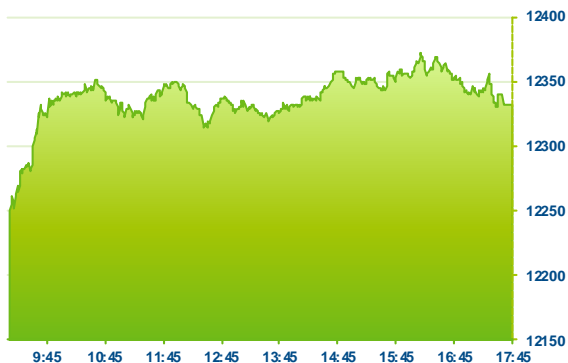
DAX (předchozí den)

Německý index DAX uzavřel první obchodní den tohoto týdne růstem 1,05 % na 12 339 b. Posilovaly společnosti ve všech sektorech, ale nejlepších výsledků zaznamenal sektor zdravotnický, spotřebitelský a sektor materiálů. Celkově dvacet osm společností uvnitř indexu dnes uzavřelo silnější. Jediné akcie, které uzavřely těsně pod hranicí nuly, patří bance Commerzbank (CBK; -0,1 %) a společnosti Vonovia (VNA; -0,1 %). Nejvýznamnější roli hrály v indexu akcie společnosti Linde (LINU; +2,5 %), která dnes splnila podmínky pro získání povolení od regulačních orgánů Evropské unie k provedení 45 miliardové fúze (v USD) s americkou společností Praxair a akcie společnosti Bayer (BAYN; +3,0 %), jejíž cílovou cenu navýšila na 95 EUR švýcarská banka Credit Suisse (aktuální průměrná cílová cena akcií Bayer je 109,59 EUR). Euro dnes během dne mírně oslabilo, ale ke konci dne ztrátu zvrátilo a nyní posiluje proti americkému dolaru o 0,02 % na 1,1439 USD za Euro.