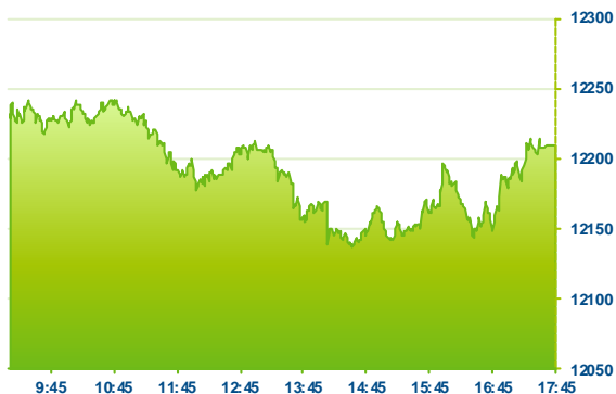
DAX (předchozí den)

Německý DAX uzavřel páteční seanci mírně v červených barvách, když odepсал 0,22 %. V průběhu druhé poloviny seance však index nabral výraznější ztráty, které se mu povedlo umazat až v závěru obchodování. Index táhly do záporu zejména ztráty společností Heidelberg (HEI; -2,6 %) či ThyssenKrupp (TKA; -1,8 %). Oslobovaly také bankovní tituly Deutsche Bank (DBK; -1,3 %) a Commerzbank (CBK; -1,1 %). Nedařilo se ani technologické firmě Infineon (IFX; -1,3 %). Na opačné straně indexu uzavřela společnost Bayer (BAYN; +1,8 %), která se tak alespoň částečně rehabilitovala z výrazných propadů v tomto týdnu, které měly na svědomí soudní problémy Bayerem nedávno akizované americké firmy Monsanto. Mírněji posílila energetika E.ON (EOAN; +0,9 %).