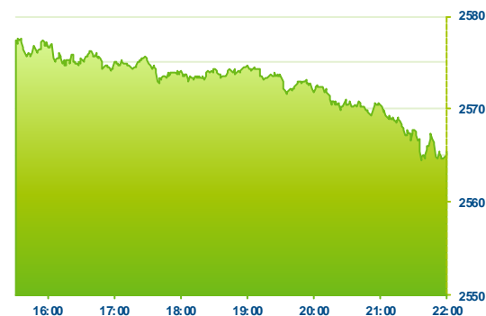
S&P 500 (předchozí den)

Americké akciové trhy na začátku týdne mírně zkorigovaly a index Dow Jones ztratil 0,23% a širší S&P 500 oslabil o 0,39%. Obchodování se zatím stále neslo na vlně optimismu a to díky schválení amerického návrhu rozpočtu na fiskální rok 2018. Toto rozhodnutí přináší klid i na ostatní druhy aktiv. Návrh rozpočtu odstranil zásadní překážku v úsilí prezidenta Donalda Trumpa o daňovou reformu. Republikány kontrolovaný Senát návrh schválil a usnesení Senátu se opírá o legislativní nástroj, který republikánům umožňuje schválit daňovou reformu nikoliv většinou 60, ale prostou většinou 51 hlasů. Z této situace těžil dolar, který na páru s eurem posil k hodnotě 1,1748 tj. 0,31%.