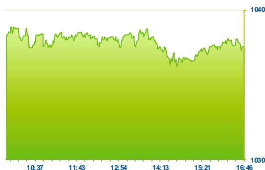
PX (předchozí den)

Na závěr týdne pražská burza mírně rostla, index PX uzavíral výše +0,3% na 1057 bodech. Jinak poklidné aktivitě se vymykaly dva tituly - ČEZ a Moneta, kde včetně závěrečné aukce proteklo současně 500 mil. Kč. Akcie ČEZ zůstaly pod metou 460 Kč (-0,4%) a v červených číslech končila také Moneta, jež oslabil na 75,05 Kč (-0,5%). Růst nad 350 Kč neudržel také Unipetrol, jež v závěrečné aukci klesl zpět na 347 Kč (-0,6%). Naopak na druhé straně spektra byla Erste, již se podařilo posílit na 975 Kč (+1,3%). Ještě o něco více přidala společnost O2 (+2,1%), která tak uzavírala nad 260 Kč. Mediální CETV posílila na 103 Kč (+1,6%) a akcie Komerční banky udržely úroveň 960 Kč (+0,4%).