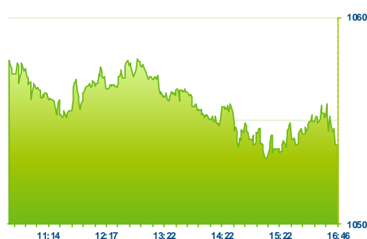
PX (předchozí den)

Pražská burza tento týden hledá směr dalšího vývoje, když po pondělním poklesu a včerejším růstu dnes opět klesla. Index PX zakončil slabší o -0,20% na 1 053 bodů. Čez ráno atakoval metu 460 Kč, nicméně nakonec odepsal -0,52% na 455 Kč. Druhým dnem pokračoval výběr zisků na akciích Cme, které ztratily -3,24% na 100 Kč. Vzhledem k tomu, že dnes silně stouply výnosy dluhopisů v Evropě, dařilo se bankovnímu sektoru. To pomohlo i rakouským finančním titulům a Erste Bank posílila o 1,53% na 974 Kč a Vig o 0,26% 647 Kč. Tuzemské banky se vydaly vlastní cestou, když Moneta Money Bank zakončila bez výraznější změny a Komerční banka odepsala -0,90% na 964 Kč. Po včerejší mírné růstové korekci se na klesající dráhu vrátily akcie O2 (256 Kč -0,54%). Nedařilo se ani Fortuně (-2,03%). Naopak před zítřejším výsledkovým reportem si polepšil Unipetrol o +0,50% se závěrem těsně pod 344 Kč.