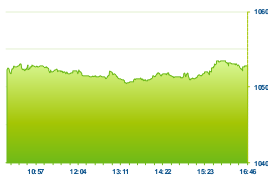
PX (předchozí den)

opětovným zájmem a růstem kurzu na úroveň historických maxim (347 Kč, +1,58%).