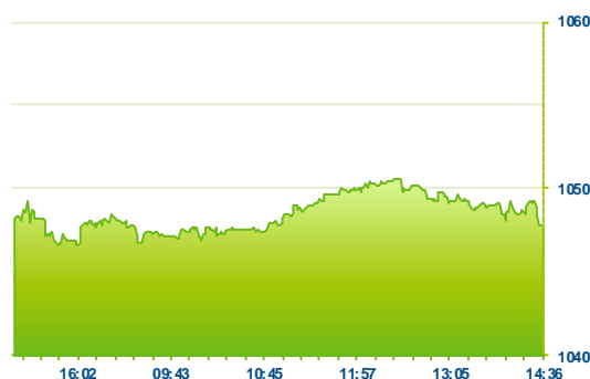
PX (předchozí den)

Po třech mírně ztrátových seancích v tomto týdnu, dnes pražská burza obrátila a index PX posílil o nepatrných +0,05%. Po včerejším zasedání Fedu došlo k nárůstu výnosů na dluhopisových trzích, z čehož těžil bankovní sektor. Podporu tak měly rakouské finanční emise, když Erste Bank posílila o +1,20% na 958 Kč a Vig o +0,49% na 641 Kč. Naopak Komerční banka oslabila o -0,71% na 973 Kč poté, co finanční ředitel připustil, že banka bude pravděpodobně nucena snížit výhled pro růst úvěrového portfolia v roce 2017. Nedařilo se ani akciím Moneta Money Bank se závěrem pod 79 Kč (-0,57%). Denní ztráty v závěru seance odmazal Čez (436 Kč +0,37%) a překlopil se do zisku, když Energo-Pro podala upravenou nabídku na koupi bulharských aktiv za vyšší cenu, než Čez požadoval. Nedařilo se akciím O2 (-0,98% 273 Kč), Unipetrolu se závěrem pod 440 Kč (-0,73%) a Cme (-0,56% 89 Kč).