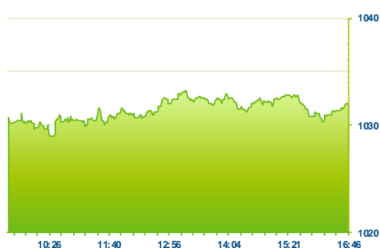
PX (předchozí den)

Pražská burza v úvodu nového týdne mírně oslabila, když index PX poklesnul o 0,1% na závěrečných 1032,04 bodů. Aktivita na trhu byla poměrně nízká, objem zobchodovaných obchodů dosáhl pouze 370 mil. Kč. Vývoj na domácím trhu byl podstatně lepší než na trzích v západní Evropě, kde DAX v závěru obchodování ztrácel kolem 1%. S tímto sentimentem se tradičně nejvíce svezly akcie Erste Group, které oslabily o necelé 1% a vrátily se na lokální minima z minulého týdne. Procento před výsledky, které bude reportovat zítra, oslabily rovněž akcie VIGU. Ztráty rakouských emisí v indexu vyvažovaly tak jako v posledních dnech ČEZ a Moneta. Akcie energetické společnosti dnes navázaly na zvýšený zájem z posledních dní a při nejvyšším objemu posílily o 0,78%. Kurz 424,40 Kč je nejvyšší po technickém propadu po rozhodném dni pro dividendu, který byl na konci června. Kurz ČEZu posílil již v šesti po sobě jdoucích seancích. Moneta posílila o 1% a dostala se na dohled 77 Kč, Komerční banka oslabila o 0,5%, nad hranici 1000 Kč se nakonec však udržela. Z firemních zpráv dnes zaujala informace o navýšení podílu R2G Rohan v Pegasu. Firma již disponuje podílem ve výši 10,8%. V tomto týdnu by mělo dojít ke zveřejnění podmínek dobrovolné nabídky na odkup akcií Pegasu včetně stanoviska managementu. Kurz Pegasu dnes posílil o 0,89% a zavíral nad avizovanou odkupní cenou 1010 Kč.