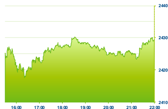
S&P 500 (předchozí den)

Hlavní americké indexy Dow Jones a S&P 500 otočily počáteční ztrátovou seanci a uzavřely pondělí v nepatrném plusu. Naopak technologický Nasdaq ztrácel. Z jednotlivých sektorů se nedařilo energetickým společnostem, které táhla dolů klesající ropa. Klesaly i finanční společnosti v reakci na pokles amerických výnosů, v závěru seance však finanční sektor část ztrát umazal a odepsal pouze dvě desetiny procenta. Mírně v záporu uzavřel i sektor informačních technologií. Naopak se dařilo sektoru realit a telekomunikačním společnostem. Z jednotlivých společností si z indexu S&P 500 nejhůře vedl Foot Locker (FL; -7,2 %), který tak rozšiřuje páteční výraznou ztrátu po neuspokojivých kvartálních výsledcích. Firma se tak dočkala několika snížených doporučení, přičemž například USB srazil cílovou cenu pro Foot Locker na 37 dolarů z předchozích 70 dolarů.