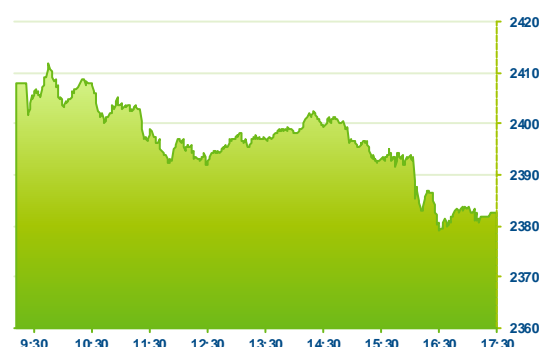
WIG 20 (předchozí den)

Polské akcie dnes pokračovaly podobně jako většina evropských trhů v poklesu. Index WIG30 oslabil o 1,0% na 2 762 bodů. Nedařilo se zejména energetickým společnostem (ENG -7,5%, ENA -5,4%) a realitnímu Globe Trade Center (GTC -3,5%). Rostly naopak akcie herního CD Projektu (CDR +0,8%) a bank (ALR +0,9%, ING +1,0%).