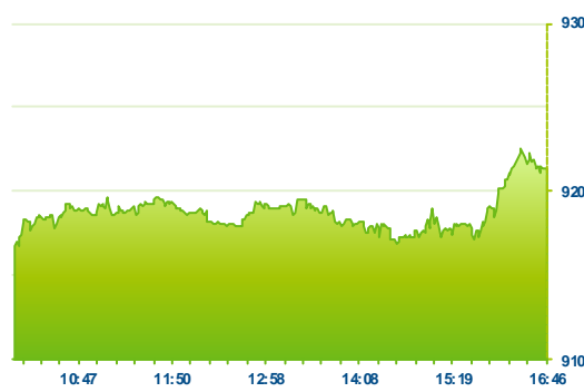
PX (předchozí den)

dlouhých odstavkách tak investoři nyní upírají hlavní pozornost na celkovou výši pojistného plnění, vývoj makro prostředí (marže) a především budoucí dividendy.