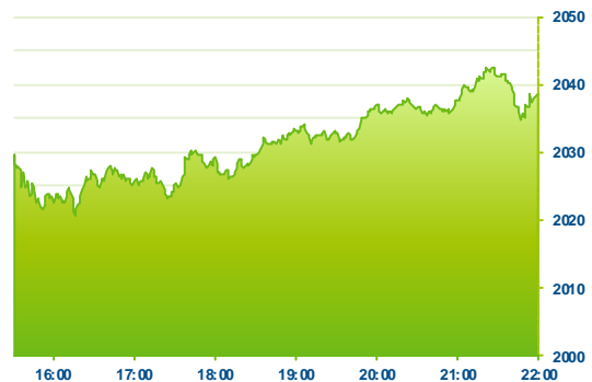
S&P 500 (předchozí den)

Po včerejšku i dnes rostly americké akciové indexy. Štávu jim dodaly především energetické tituly a těžaři, kterým pomohla rostoucí cena ropy. Do konce roku nejsou na programu žádná významná makrodata (poslední proběhla dnes) a tak burza obchoduje ve vánočním režimu, tedy za snižujících se objemů. Mimo již zmíněných sektorů rostly i firmy z oboru průmyslu. Například Caterpillar (CAT +4,86%) je dnes lídr tohoto sektoru a umazává ztráty z posledního měsíce zaviněného soudním sporem a pokutou za krádež obchodního tajemství. Na základě slušných předběžných dat o maloobchodních tržbách v průběhu prosince rostl i Wal-Mart (WMT +1,63%). Po ohlášení převzetí společnosti SolidFire Inc. v hodnotě 870 milionů dolarů klesaly akcie softwarového NetAppu (NTAP -4,96%).