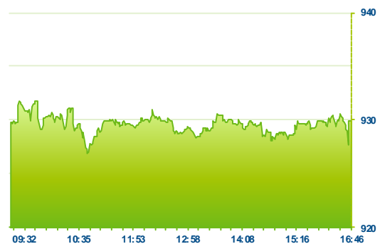
PX (předchozí den)

Pražská burza zakončila úterní seanci s mírným ziskem a to 0,15% na 929 bodech. Nicméně aktivita s blížícími se svátky klesá. Celkový zobchodovaný objem 400 mil. Kč zaostal za denním průměrem, který je téměř 700 mil. Kč. Dařilo se především Komerční bance se ziskem 1,3% na 4 839 Kč a akciím O2 s přírůstkem 1,21%. Elektrárenská společnost Čez (412 Kč +0,32%) stagnovala lehce nad včerejším závěrem. Dnes se nedařilo především pojišťovně Vig (-1,32% 675 Kč) a Unipetrolu (159 Kč -1,18%). Největší kurzový pohyb zaznamenalo nelikvidní NWR a to +11,11%. Naopak zbytek titulů zaznamenalo kurzovou změnu nepatnou, když se vešly do +- 0,5%.