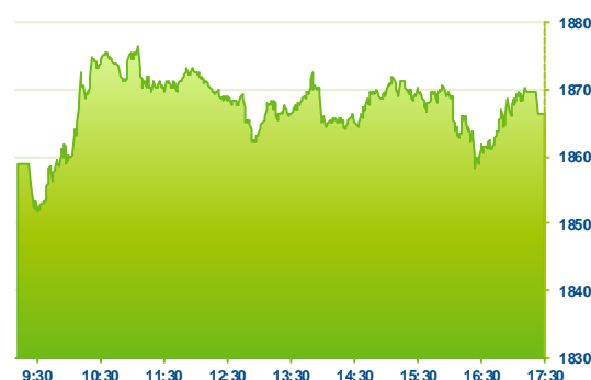
WIG 20 (předchozí den)

Po jmenování nového CEO ztrácel také železniční přepravce PKP Cargo (PKP, -3,1 %).