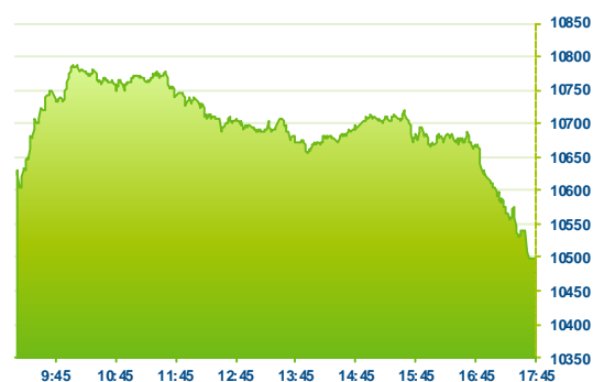
DAX (předchozí den)

Německé akcie se většinu první seance nového týdne udržovaly v zelených číslech. Po výprodejích v samém závěru obchodování však končí v červených číslech. Závěrečný gong zastihl index DAX na 10 498 bodech (-1,0%). Nedařilo se zejména výrobcí průmyslových plynů Linde (LIN -2,5%), zdravotnické Fresenius Medical (FME -2,5%) a Deutsche Boerse (DB1 -2,5%). Rostla naopak letecká Lufthansa (LHA +2,7%), jejíž dozorčí rada schválila navýšení odměn pro Carstena Spohra, současného generálního ředitele společnosti a dvojice energetických společností RWE (RWE +2,1%) a E.On (EOAN +1,9%).