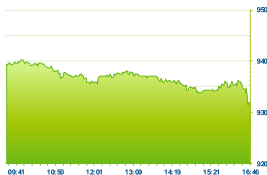
PX (předchozí den)

Přestože bylo včerejší rozhodnutí Fedu o zvýšení sazeb o 0,25% očekávané, tak na globálních akciových trzích spustilo silnou rally. Investory totiž povzbudil komentář, že další zvyšování nebude automatické a bude záviset na kondici americké ekonomiky. Nicméně pražská burza svým výkonem za světem opět zaostala, když index PX posílil pouze o 0,18% na 931 bodů. Z rozhodnutí Fedu těžily v zahraničí především bankovní tituly, což se projevilo i na našem trhu. Konkrétně Erste Bank posílila o 0,84% na 758 Kč a Komerční banka přidala 1,38% na 4 849 Kč. Vyšší zisky indexu brzdily akcie Čezu, které zůstávají nadále v nemilosti investorů a dnes oslabily o -1,22% pod 420 Kč. Nicméně negativní výkonnost zaznamenaly i akcie O2 (242 Kč - 2,22%) a Unipetrolu (160 Kč -1,48%). Naopak nejlepším titulem se dnes staly akcie Cme (65 Kč + 6,56%), které vystartovaly nahoru bez nové zprávy s openem US trhů.