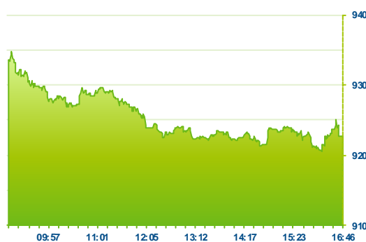
PX (předchozí den)

Pražská burza se v pátek po dvou dnech klidu a stagnace vrátila k poklesům. Index PX nakonec uzavíral níže -0,95% na 922,7 bodu. Tato úroveň je pro zajímavost hladina 23,6% Fibonacciho návratu mezi maximem z roku 2007 a minimem z roku 2009. A pak, že na trzích neobchodují stroje... Od listopadového maxima domácí trh ztratil téměř -8% a od začátku letošního roku jsme se přehoupli do ztráty -2,5%. Současné výprodeje a volatilita asi mají co do činění s pravděpodobným zvýšením sazeb v USA příští týden. Domácímu trhu a EM trhům jako celku rovněž nepřispívají výprodeje na komoditách. Když ještě do toho ČEZ oznámil další posun v odstávce na JE Dukovany, tak není divu, že akcie propadly pod 430 Kč (-2,9%). Bankovní tituly ztrácely kolem -1%. Komerční banka přes úvodní růst na 4940 Kč nakonec uzavírala na 4845 Kč. Akcie Erste při denním minimu u 710 Kč nakonec stačily zabrat alespoň na 725 Kč. Společnost O2 se obchodovala na 250 Kč (-2,1%). Našly se však i růstové tituly. Mediální CETV poskočila na 58,40 Kč (+5,2%) a Stock korigoval předchozí propady růstem na 46,9 Kč (+6,6%).