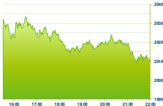
S&P 500 (předchozí den)

Propady na akciových a komoditních trzích se v pátek přehouply rovněž do zámoří. Indexy startovaly prudkým poklesem kolem -1%. Jelikož kupci přes den neměli dostatek síly k obratu, trhy v závěru oslabují k novým minimům. Sledovaný index SP500 se tak nebezpečně přibližuje k psychologické metě 2000 bodů (-2%). Především na komoditním trhu s ropou je vidět doslova likvidace pozic. Nová minima pod 36 USD za barel jsou nejnižší úrovně od finanční krize v roce 2008. Výprodeje na akciích jsou tak patrné v energetickém a komoditním sektoru. Všech 40 členů energetického sektoru se obchoduje v červených číslech. Ale poklesy se nevyhýbají ani ostatním titulům. Úvodní růsty vzdal např. Twitter (-4%), těsně nad 113 USD (-2,5%) se obchoduje Apple. Nevedlo se ani bankovním titulům, jež v průměru umazaly -2,5%.