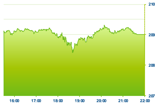
S&P 500 (předchozí den)

akciového růstu. Další výraznější zisky však společnosti během dnešní zkrácené, poprázdňové seance nezaznamenaly.