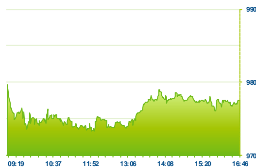
PX (předchozí den)

Pražská burza završila nepodařený týden další ztrátovou seancí. Index PX sice v úvodu týdne atakoval hranici 1000 bodů, dlouhého trvání to však nemělo a postupně se hodnota vrátila pod hranici 980 bodů. Na závěr týdne index oslabil o 0,41% a končil na 977,58 bodech. Pojišťovna VIG, jakožto nejztrátovější titul tohoto týdne (bez NWR -33%), oslabovala i dnes a zakončila den se ztrátou 1,09% na 725 Kč. Snižování cílových cen po nevydařených výsledcích pokračovalo i dnes, průměrná cílová cena dle agentury Bloomberg však zůstává vysoce nad úroveň současného kurzu a nabízí více jak 25% potenciál. V posledních dnech se nedařilo příliš Erste Group, navzdory růstu zahraničních trhů, a negativní výkonnost titul předvedl i dnes. Kurz oslabil o 0,9% a ve Vídni se pohyboval na krátkodobě důležité hranici 28 EUR. Proti trhu šla Komerční banka, která při jednom z největších objemů (89 mil. Kč) na trhu posílila o 0,79%. Ještě větší objem si připsaly akcie O2 a staly se po delší době nejobchodovatelnějším titulem na našem trhu. Kurz posílil o 0,97% na 261 Kč. Závěrečná aukce vrátila kurz opět o něco níže a oslabil nakonec o 1,3%. Společnost Stock Spirits po close na našem trhu snížila výhled, což bude ovlivňovat obchodování v pondělí.