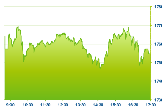
WIG 20 (předchozí den)

Závěrečný gong zastihl index WIG30 na 1 959 bodech (-0,4%). Nejhůře si vedli akcie ING Bank Slaski (ING -3,8%), elektrárenské Enea (ENA -2,7%) nebo realitního Globe Trade Center (GTC -2,9%). Druhou ze jmenovaných společností tíží prodejní doporučení pro utility od Pekaa. Rostl naopak televizní Cyfrowy Polsat (CPS +2,8%), který koriguje nedávné poklesy, mBank (MBK +2,6%) a uhelná JSW (JSW +1,0%).