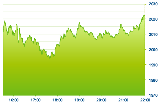
S&P 500 (předchozí den)

Zámořské akciové trhy vstupují do nového týdne nejspíše ale v zisku. Po většinu dne se hlavní akciové trhy obchodovaly v záporném teritoriu a až v poslední hodině se vytáhly do zisku. Hlavním důvodem byla nejistota před středečním zasedáním FEDu, kde se čeká zvýšení sazeb. Stabilně se dnes choval americký dolar, který mírně oslabil vůči euru. Mnoho investorů jistě dumá, kam se dolar vydá po středečním dni „D“. Jednotlivé sektory si dnes vedly smíšeně. Nejlépe se dařilo telekomunikacím a energetickým titulům. Naopak klesaly základní materiály a průmyslové společnosti. Dařilo se dnes sektoru výrobců solárních panelů, kde díky zprávě, že Trina Solar (TSL +11,68%), bude předmětem nabídky převzetí od skupiny privátních investorů a bank za cenu 11,6 USD za akcii. Nabídka je zhruba 20% nad pátečním zavírací hodnotou. Rostly tudíž i ostatní tituly ze sektoru, jako JASO, CSIQ nebo FSLR. Direkt dnes obdrželi akcionáři výrobce sportovních kamer GoPro Inc. (GPRO -9,61%), potom co analytici od MorganStanley skoro.