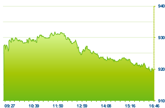
PX (předchozí den)

Pražská burza stále nenašla pevnou půdu pod nohama. Indexy PX oslabil o 0,32% na 919,73 bodů a prohloubil letošní minimální hodnoty. Úvod obchodování se sice nesl v pozitivním duchu, když trhy v západní Evropě umazávaly část svých předchozích ztrát a futures na US indexy indikovaly dopoledne kladný vývoj. Za alespoň částečně zlepšeným sentimentem stály dobrá víkendová data z Číny. Situace se však v průběhu dne opět podstatně změnila, když ropa obnovila své poklesy a strhla akciové indexy opět do červených čísel. Nejvíce negativních bodů do indexu přidaly bankovní tituly. U Komerční banky je stále na nabídkové straně přetlak a titul při největším objemu (170 mil. Kč) oslabil o 1% těsně pod hranici 4800 Kč. VIG se v závěrečné aukci propadnul na 676 Kč (-1,3%), Erste ztratila 0,3% na závěrečných 722,50 Kč. V mírně kladných číslech se naopak dokázal udržet CEZ (+0,21%). Změny v akciových podílech pomáhaly menším emisím. Navýšení podílu ze strany TCS Capital Management podpořil akcie mediální CME a titul si připsal 3,6%. Stock Spirit si připsal růst o 2,35% poté, když svůj podíl ve výši 8,1% odhalil největší akcionář polského maloobchodního řetězce Eurocash a jeho CEO Luis Manuel Do Amaral.