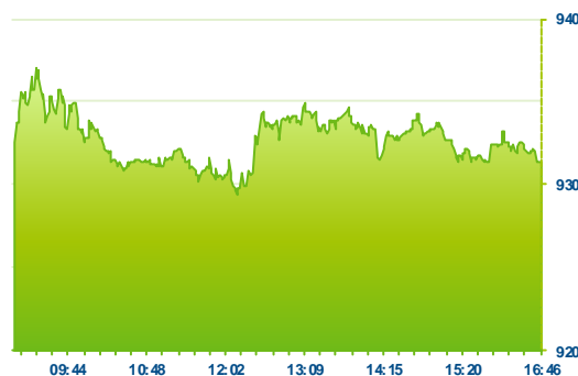
PX (předchozí den)

Pražská burza přerušila negativní sérii osmi poklesů v řadě, nicméně posun indexu PX vzhůru byl pouze symbolický a to +0,08% na hodnotu 931. Čez nepatrně korigoval včerejší silný propad (téměř -5%), když posílil o 1% na 433 Kč při objemu 124 mil. Kč. Na srovnatelném objemu 126 mil. Kč mírně odmazala včerejší ztrátu i Komerční banka se závěrem 4 926 Kč (+0,65%). Naopak klesaly rakouské finanční emise poté, co včera byl primární trh ve Vídni uzavřen. Erste Bank ztratila -1,51% na 742 Kč a Vig uzavřel slabší o -0,57% na 692 Kč. Dařilo se akciím O2, které posílily o 1,08% na 253 Kč. Nejúspěšnějšími tituly však byly Unipetrol s přírůstkem 2,86% nad hladinu 160 Kč a Stock Spirits se ziskem 4%. V záporném teritoriu uzavíralo Cme (-1,49%) a Pegas (-0,98%). Celkový zobchodovaný objem byl podprůměrný a to mírně nad 400 mio. Kč.