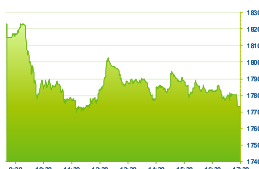
WIG 20 (předchozí den)

Polské akcie nedokázaly těžit z růstové korekce na většině evropských trhů a dále oslabovaly. Index WIG30 uzavřel se ztrátou 2,3% na 1 988 bodech, poprvé po dlouhé době pod psychologickou hranici 2 000 bodů. V porovnání s ostatními evropskými trhy patří mezi nejslabší. Nedařilo se oděvnímu LPP (LPP -9,1%), které dnes obdrželo nižší cílovou cenu od ING, obuvnickému CCC (CCC -7,7%) nebo maloobchodnímu Eurocash (EUR -6,3%). Díky růstové korekci na ropě a ostatních komoditách posilovaly energetické a těžební společnosti (TPE +9,3%, PGN +1,2%, ENG +2,5%). První ze jmenovaných titulů těžší z včerejších změn ve vedení společnosti.