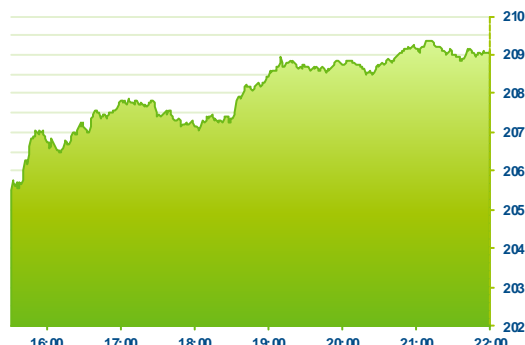
S&P 500 (předchozí den)

další subindexy S&P 500 rostly v čele s telekomunikacemi (+2,7 %) a finančními společnostmi (+2,5 %).