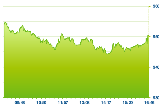
PX (předchozí den)

Pražská burza v závěru týdne uzavírala s červenou nulou, když index PX končil na 950 bodech. Domácí trh se tak alespoň snažil konsolidovat kolem hladin silné technické podpory po předchozích propadech. Největší aktivitou se prezentovala Komerční banka, jež při 270 mil. Kč bojovala o hladinu 5000 Kč. Akciím Erste se podařilo ke konci dne zvednout na 768 Kč (+1,4%). Včerejší zisky však odevzdaly akcie ČEZU, které postupně propadly zpět na 454,50 Kč (-2,5%). Akcie společnosti O2 ke konci dne umazaly propad na 243 Kč a nakonec se obchodovaly u 250 Kč (-2,3%). Tituly s menší kapitalizací spíše rostly. To byl případ Pegas (+2,2%), CETV (+2%) či Fortuny (+3,3%). Akcie nováčka Kofoly se propadly pod IPO cenu na 502,5 Kč (-1,9%).