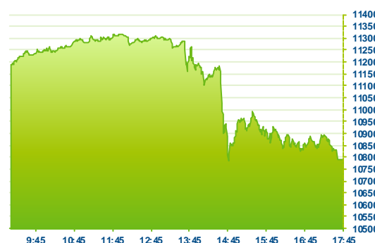
DAX (předchozí den)

Značný ústup ze slávy dnes zažily německé tituly. Na vině je ECB, která dnes ohlásila další snížení depozitních sazeb hlouběji do záporu a navíc rozšířené stimuly pro podporu ekonomiky a vyvolání toužebné inflace. Trhům to však nebylo dost a tak se odepisovaly tučné procenta ze všech sektorů. Jde o největší poklesy od srpna letošního roku, kdy byla na trzích korekce z důvodu nedůvěry ve výkonnost čínské ekonomiky. Daimler (DAI -5,34%) byl nejhorším titulem v indexu DAX, nedařilo se ale bez výjimky všem. Sektor zdravotní péče odepsal 4%, průmyslové společnosti 3,5%. Nejmenší propady zažil sektor utilit, když EON (EOAN -0,31%) byl nejlepším z hlavního indexu. Vítězem dnešního dne je bezesporu euro, které na páru s dolarem posílilo o 3%. Jde o největší jednodenní růst od roku 2009.