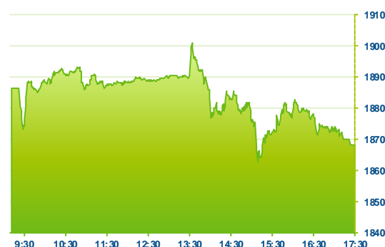
WIG 20 (předchozí den)

Na druhé straně se nedařilo pojišťovně PZU (PZU; -3,5 %), PKO Bank (PKO; -2,6 %), výrobce slunečnicového oleje Kernel (KER; -2,3 %) a energetické společnosti Energa (ENG; -1,6 %).