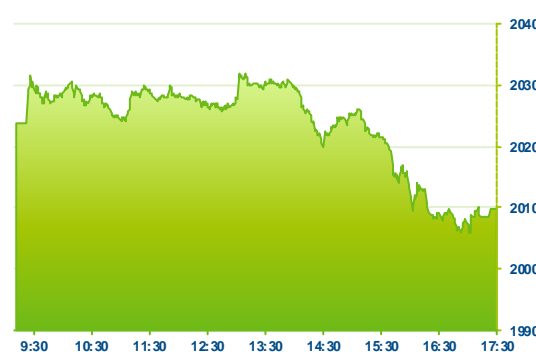
WIG 20 (předchozí den)

Na nejistý dnešní open v USA však burza ve Varšavě reagovala na rozdíl od většiny ostatních evropských trhů propadem do červených čísel. Index WIG30 uzavřel se ztrátou 0,5% na 2 232 bodech. Patří tak mezi nejslabší na Starém kontinentě. Nedařilo se zejména zemědělskému Kernelu (KER -4,8%), plynářskému PGNiG (PGN -2,1%) nebo Polske Grube Energetyczne (PGE -2,9%). Rostlo naopak železniční PKP Cargo (PKP +3,9%), která dnes podepsala tříletý kontrakt na dopravu uhlí pro elektrárnu PGE Dolna Odra, Bank Handlowy (BHW +4,0%) a rafinérský Lotos (LTS +2,4%).