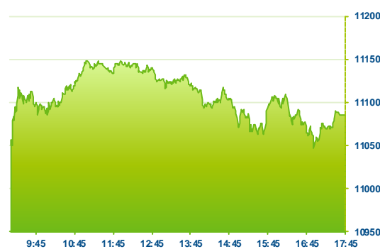
DAX (předchozí den)

Hospodářské výsledky za fiskální 4Q 2015 dnes ráno reportoval výrobce oceli Thyssenkrupp (TKA, +2,6 %). Společnost ve FY 2015 dosáhla poprvé za posledních 9 let kladného cash flow před divesticemi.